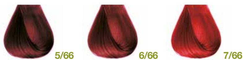
castano chiaro rosso Red light brown - Castaño claro rojo Châtain clair rouge - Hellbraun Rot Intensiv Castanho claro cobre Каштановый светло-красный ΚΑΣΤΑΝΟ ΑΝΟΙΧΤΟ ΚΟΚΚΙΝΟ ΕΝΤΟΝΟ • ألوان البندقى فاتح biondo scuro rosso intenso Deep red dark blond - Rubio oscuro rojo intenso Blond foncé rouge intense - Dunkelblond Rot Intensiv Louro escuro vermelho intenso Блондин темно-красный интенсивный ΞΑΝΘΟ ΣΚΟΥΡΟ ΚΟΚΚΙΝΟ ΕΝΤΟΝΟ • ألوان البندقى فاتح biondo rosso intenso Deep red blond - Rubio rojo intenso Blond rouge intense - Mittelblond Rot Intensiv Louro vermelho intenso Блондин красный интенсивный ΞΑΝΘΟ ΚΟΚΚΙΝΟ ΕΝΤΟΝΟ • ألوان البندقى فاتح