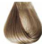
8/1 biondo chiaro cenere Ash light blond - Rubio claro ceniza Blond clair cendre - Hellaschblond - Louro claro cinza Блондин светло-пепельный - ΣΑΒΒΟ ΑΝΟΙΧΤΟ ΣΑΝΤΡΕ انظر فاتح رمادي