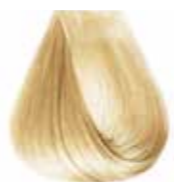
10/0 biondo platino Platinum blond - Rubio platino - Blond platine Platinblond - Louro extraclaro - Блондин платиновый ΚΑΤΑΞΑΝΘΟ - انظر خيمر