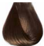
5/0 castano chiaro Light brown - Castaño claro - Châtain clair - Hellbraun Castanho claro - Каштановый светлый ΚΑΣΤΑΝΟ ΑΝΟΙΧΤΟ - كستاني فاتح