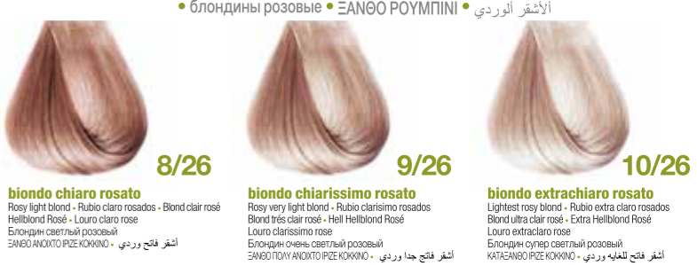
biondo chiaro rosato Rosy light blond - Rubio claro rosados - Blond clair rosé Blond très clair rosé - Hell Hellblond Rose Louro extraclaro rose Блондин светлый розовый ΞΑΝΘΟ ΑΝΟΙΧΤΟ ΡΙΖΕ ΚΟΚΚΙΝΟ • ألوان البندقى فاتح biondo chiarissimo rosato Rosy very light blond - Rubio clarissimo rosados Blond très clair rosé - Hell Hellblond Rose Louro clarissimo rose Блондин очень светлый розовый ΞΑΝΘΟ ΠΟΛΥ ΑΝΟΙΧΤΟ ΡΙΖΕ ΚΟΚΚΙΝΟ • ألوان البندقى فاتح biondo extrachiaro rosato Lightest rosy blond - Rubio extra claro rosados Blond ultra clair rosé - Extra Hellblond Rose Louro extraclaro rose Блондин супер светлый розовый ΚΑΤΑΣΑΝΟ ΡΙΖΕ ΚΟΚΚΙΝΟ • ألوان البندقى فاتح