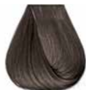
6/11 biondo scuro cenere intenso Intensive ash dark blond - Rubio oscuro ceniza intenso Blond foncé cendre intense - Intensiv asch dunkelblond Louro escuro cinza intenso - Блондин темный интенсивный пепельный ΣΑΒΒΟ ΣΚΟΥΡΟ ΣΑΝΤΡΕ ΕΝΤΟΝΟ - انظر غامق رمادي لكثيف