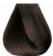
6/00 biondo scuro intenso Intensive dark blond - Rubio oscuro intensive Blond foncé intensive - Dunkelblond Intensiv Castanho claro intensivo Каштановый темный интенсивный ΣΑΒΒΟ ΣΚΟΥΡΟ ΕΝΤΟΝΟ - انظر غامق كثيف