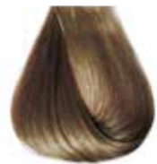
8/01 biondo chiaro cenere Ash very light blond - Rubio clarísimo ceniza Blond très clair cendre - Hell Hellblond Kalt Louro claro cinza Блондин очень светлый пепельный ΣΑΒΒΟ ΑΝΟΙΧΤΟ ΕΝΤΟΝΟ ΣΑΝΤΡΕ - انظر فاتح رمادي