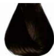
4/00 castano naturale intenso Intensive natural brown - Castaño natural intensive - Châtain naturel intensive Naturbraun Intensiv - Castanho natural intensivo Каштановый натуральный интенсивный ΚΑΣΤΑΝΟ ΦΥΣΙΚΟ ΕΝΤΟΝΟ - كستاني غامق كثيف