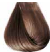
7/07 tabacco Tobacco - Tabaco - Tabac - Mittelblond Tabak Tabaco - Табак - ΣΑΒΒΟ ΦΥΣΙΚΟ ΤΑΜΠΑΚΟ - بني مائل للصفرة