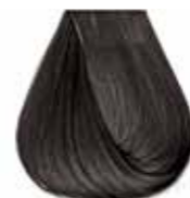
5/11 castano chiaro cenere intenso Intensive ash light brown - Castaño claro ceniza intenso Châtain clair cendre intense - Intensiv asch hellbraun Castanho claro cinza intenso - Каштановый светлый интенсивный пепельный ΚΑΣΤΑΝΟ ΑΝΟΙΧΤΟ ΣΑΝΤΡΕ ΕΝΤΟΝΟ - كستاني فاتح رمادي لكثيف