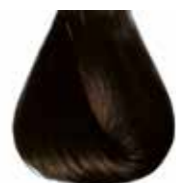
5/00 castano chiaro intenso Intensive light brown - Castaño claro intensive Châtain clair intensive - Hellbraun Intensiv Castanho claro intensivo Каштановый светлый интенсивный ΚΑΣΤΑΝΟ ΑΝΟΙΧΤΟ ΕΝΤΟΝΟ - كستاني فاتح كثيف