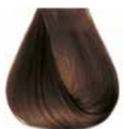
7/00 biondo naturale intenso Intensive natural blond - Rubio natural intensive Blond naturel intensive - Mittelblond Intensiv Louro natural intensivo Блондин натуральный интенсивный ΣΑΒΒΟ ΦΥΣΙΚΟ ΕΝΤΟΝΟ - انظر خيمر غامق كثيف