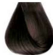
4/07 castano naturale tabacco Natural brown tobacco - Castaño natural tabaco Châtain naturel tabac - Mittelbraun Tabak Castanho natural tabaco Каштановый натуральный табачный ΚΑΣΤΑΝΟ ΤΑΜΠΑΚΟ ΦΥΣΙΚΟ - كستاني غامق بني مائل للصفرة