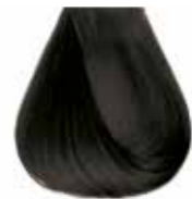
4/01 castano naturale cenere Ash natural brown - Castaño natural ceniza Châtain naturel cendre - Mittelbraun Kalt Castanho natural cinza Каштановый натуральный пепельный ΚΑΣΤΑΝΟ ΕΝΤΟΝΟ ΣΑΝΤΡΕ - كستاني غامق رمادي