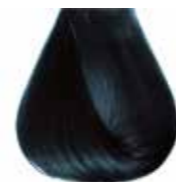
1/11 nero blu Blue black - Negro azul - Noir Bleu - Blauschwarz Preto azul - Черный-синий - ΜΑΥΡΟ ΜΠΛΕ - أسود أزرق