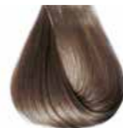
7/1 biondo cenere Ash blond - Rubio ceniza - Blond cendre Mittelashblond - Louro medio cinza Блондин пепельный - ΣΑΒΒΟ ΣΑΝΤΡΕ - انظر رمادي