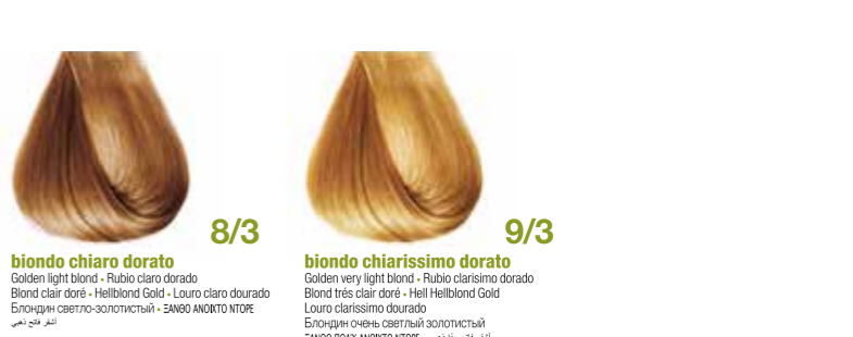
biondo chiaro dorato Golden light blond - Rubio claro dorado Blond clair doré - Hellblond Gold - Hell Hellblond Gold Блондин светло-золотистый - ΞΑΝΘΟ ΑΝΟΙΧΤΟ ΝΤΟΡΕ • ألوان الذهبي فاتح biondo chiarissimo dorato Golden very light blond - Rubio clarissimo dorado Blond très clair doré - Hell Hellblond Gold Louro clarissimo dourado Блондин очень светлый золотистый ΞΑΝΘΟ ΠΟΛΥ ΑΝΟΙΧΤΟ ΝΤΟΡΕ • ألوان الذهبي فاتح