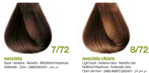
nocciola Hazel - Avellana - Noisette - Mittelblond Haselnuss Avelanado - Орех - ΞΑΝΘΟ ΣΟΚΟΛΑΤΙ • ألوان البندقى nocciola chiaro Light hazel - Avellana claro - Noisette clair Hellblond Haselnuss - Avelanado claro Орех светлый - ΞΑΝΘΟ ΑΝΟΙΧΤΟ ΣΟΚΟΛΑΤΙ • ألوان البندقى فاتح