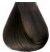
6/01 biondo scuro cenere Ash dark blond - Rubio oscuro ceniza Blond foncé cendre - Dunkelblond Kalt Louro escuro cinza - Блондин темно-пепельный ΣΑΒΒΟ ΣΚΟΥΡΟ ΕΝΤΟΝΟ ΣΑΝΤΡΕ - انظر غامق رمادي