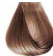
8/07 tabacco chiaro Light tobacco - Tabaco claro - Tabac clair Hellblond Tabak - Tabaco claro - Табак светлый ΣΑΒΒΟ ΑΝΟΙΧΤΟ ΦΥΣΙΚΟ ΤΑΜΠΑΚΟ - بني فاتح مائل للصفرة