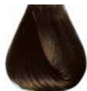
4/0 castano naturale Natural brown - Castaño natural - Châtain naturel Mittelbraun - Castanho natural Каштановый светлый ΚΑΣΤΑΝΟ - كستاني طبيعي