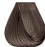
7/11 biondo naturale cenere intenso Intensive ash natural blond - Rubio natural ceniza intenso Blond naturel cendre intense - Intensiv asch mittelblond Louro medio cinza intenso - Блондин натуральный интенсивный пепельный ΚΑΣΤΑΝΟ ΦΥΣΙΚΟ ΣΑΝΤΡΕ ΕΝΤΟΝΟ - انظر خيمر رمادي لكثيف