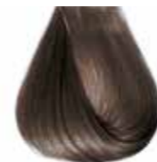
6/1 biondo scuro cenere Ash dark blond - Rubio oscuro ceniza Blond foncé cendre - Dunkelashblond Louro escuro cinza - Блондин темно-пепельный ΣΑΒΒΟ ΣΚΟΥΡΟ ΣΑΝΤΡΕ - انظر غامق رمادي