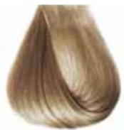
9/01 biondo chiarissimo cenere Ash light blond - Rubio claro ceniza Blond clair cendre - Hell Hellblond Kalt Louro clarissimo cinza Блондин очень светлый пепельный ΣΑΒΒΟ ΠΟΛΥ ΑΝΟΙΧΤΟ ΕΝΤΟΝΟ ΣΑΝΤΡΕ - انظر فاتح جدا رمادي