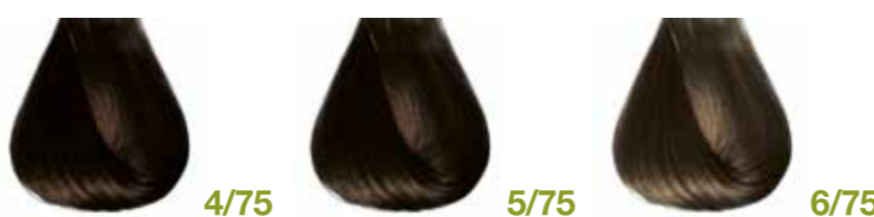
castano naturale cioccolato Natural brown chocolate - Castaño natural chocolate Châtain naturel chocolat - Mittelbraun Schokolade Castanho natural chocolate Каштановый натуральный шоколадный ΚΑΣΤΑΝΟ ΦΥΣΙΚΟ ΣΟΚΟΛΑΤΙ • ألوان البندقى فاتح castano chiaro cioccolato Light brown chocolate - Castaño claro chocolate Châtain clair chocolat - Hellbraun Schokolade Castanho natural chocolate Каштановый светлый шоколадный ΚΑΣΤΑΝΟ ΑΝΟΙΧΤΟ ΣΟΚΟΛΑΤΙ • ألوان البندقى فاتح biondo scuro cioccolato Dark blond chocolate - Rubio oscuro chocolate Blond foncé chocolat - Dunkelblond Schokolade Louro escuro chocolate Блондин темный шоколадный ΞΑΝΘΟ ΣΚΟΥΡΟ ΣΟΚΟΛΑΤΙ • ألوان البندقى فاتح