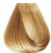
9/0 biondo chiarissimo Very light blond - Rubio clarísimo - Blond très clair Hell hellblond - Louro clarissimo Блондин очень светлый - ΣΑΒΒΟ ΠΟΛΥ ΑΝΟΙΧΤΟ ΣΑΒΒΟ - انظر فاتح جدا