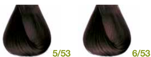
castano chiaro mogano dorato Light mahogany golden brown Castaño claro caoba dorado - Châtain clair acajou doré Hellbraun Mahagoni Gold Castanho claro acaju dourado Каштановый светло-золотистый красного дерева ΚΑΣΤΑΝΟ ΑΝΟΙΧΤΟ ΖΕΤΤΟ ΣΟΚΟΛΑΤΙ • ألوان البندقى فاتح biondo scuro mogano dorato Dark mahogany golden blond Rubio oscuro caoba dorado - Blond foncé acajou doré Dunkelblond Mahagoni Gold Louro escuro acaju dourado Блондин темно-золотистый красного дерева ΞΑΝΘΟ ΖΕΤΤΟ ΣΟΚΟΛΑΤΙ • ألوان البندقى فاتح