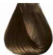
6/0 biondo scuro Dark blond - Rubio oscuro - Blond foncé - Dunkelblond Louro escuro - Блондин темный - ΣΑΒΒΟ ΣΚΟΥΡΟ - انظر غامق ΣΑΒΒΟ - انظر خيمر