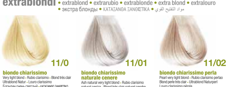
biondo chiarissimo Very light blond - Rubio clarissimo - Blond très clair Ultrablond Natur - Louro clarissimo Блондин очень светлый • ΚΑΤΑΣΑΝΟ ΞΑΝΘΙΣΤΙΚΟ كشكشى فاتح biondo chiarissimo naturale cenere Ash natural very light blond - Rubio clarissimo Ultrablond Natur - Louro clarissimo Blond très clair naturel cendre Ultrablond Naturasch - Louro clarissimo cinza Блондин очень светлый фиолетовый пепельный Блондин очень светлый натуральный пепельный ΚΑΤΑΣΑΝΟ ΞΑΝΘΙΣΤΙΚΟ ΕΑΝΤΡΕ • ألوان البندقى فاتح biondo chiarissimo perla Pearl very light blond - Rubio clarissimo perla Blond perle très clair - Ultrablond Naturperl Louro clarissimo pérola Блондин очень светлый жемчужный كشكشى فاتح