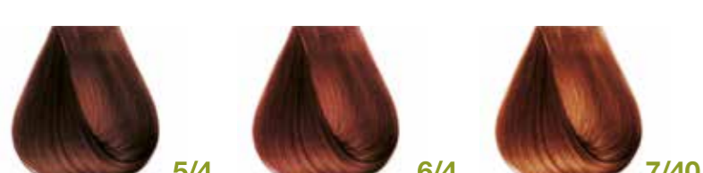
castano chiaro rame Light copper brown - Castaño claro cobre Châtain clair cuivre - Hellbraun Kupfer Castanho claro cobre Каштановый светлый медный ΚΑΣΤΑΝΟ ΑΝΟΙΧΤΟ ΧΑΛΚΙΝΟ • ألوان البندقى فاتح biondo scuro rame Dark blond copper - Rubio oscuro cobre Blond foncé cuivre - Dunkelblond Kupfer Louro escuro cobre Блондин темно-медный ΞΑΝΘΟ ΣΚΟΥΡΟ ΧΑΛΚΙΝΟ • ألوان البندقى فاتح rame intenso Deep copper - Cobre intenso - Cuivre intense Mittelblond Kupfer Intensiv - Cobre intenso Блондин медный интенсивный - ΞΑΝΘΟ ΧΑΛΚΙΝΟ ΕΝΤΟΝΟ كشكشى كحلجى • ΞΑΝΘΟ ΑΝΟΙΧΤΟ ΧΑΛΚΙΝΟ ΕΝΤΟΝΟ biondo chiaro rame dorato Golden copper light blond - Rubio claro cobre dorado Blond clair cuivre doré - Hellblond Kupfer-Gold Louro claro cobre dourado Блондин светлый медный золотистый ΞΑΝΘΟ ΑΝΟΙΧΤΟ ΧΑΛΚΙΝΟ ΝΤΟΡΕ • ألوان البندقى فاتح