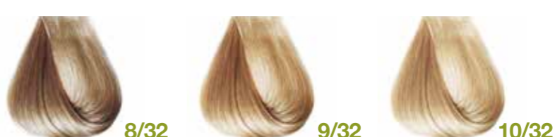
biondo chiaro miele Honey light blond - Rubio claro miel - Blond clair miel Hellblond Honig - Louro claro mel Блондин светлый медовый - ΞΑΝΘΟ ΑΝΟΙΧΤΟ ΜΕΛΙ ΡΙΖΕ كشكشى عسلي biondo chiarissimo miele Honey very light blond - Rubio clarissimo miel Blond très clair miel - Hell Hellblond Honig Louro clarissimo mel Блондин очень светлый медовый ΞΑΝΘΟ ΠΟΛΥ ΑΝΟΙΧΤΟ ΜΕΛΙ ΡΙΖΕ • ألوان الذهبي فاتح biondo extrachiaro miele Lightest honey blond - Rubio extra claro miel Blond ultra clair miel - Extra Hellblond Honig Louro extraclaro mel Блондин супер светлый медовый ΚΑΤΑΣΑΝΟ ΜΕΛΙ ΡΙΖΕ • ألوان الذهبي فاتح