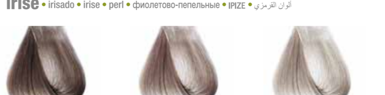
biondo chiaro irisè cenere Light violet ash blond - Rubio claro irisado ceniza Blond clair irise cendre - Hellblond Perl - Asch Louro claro irisado cinza Блондин светлый фиолетовый пепельный ΞΑΝΘΟ ΑΝΟΙΧΤΟ ΒΙΟΛΕ ΕΑΝΤΡΕ • ألوان البندقى فاتح biondo chiarissimo irisè cenere Very light violet ash blond Rubio clarissimo irisado ceniza Blond très clair irise cendre - Hell Hellblond Perl - Asch Louro clarissimo irisado cinza Блондин очень светлый фиолетовый пепельный ΞΑΝΘΟ ΠΟΛΥ ΑΝΟΙΧΤΟ ΒΙΟΛΕ ΕΑΝΤΡΕ • ألوان البندقى فاتح biondo extrachiaro irisè cenere Lightest violet ash blond Rubio extra claro irisado ceniza Blond extra clair irise cendre - Hell Hellblond Perl - Asch Louro extra claro irisado cinza Блондин экстра светлый фиолетовый пепельный ΚΑΤΑΣΑΝΟ ΒΙΟΛΕ ΕΑΝΤΡΕ • ألوان البندقى فاتح