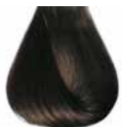
3/0 castano scuro Dark brown - Castaño oscuro - Châtain foncé Dunkelbraun - Castanho escuro - Каштановый темный ΚΑΣΤΑΝΟ ΣΚΟΥΡΟ - كستاني غامق