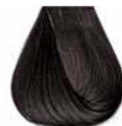
4/11 castano naturale cenere intenso Intensive ash natural brown - Castaño natural ceniza intenso Châtain naturel cendre intense - Intensiv asch mittelbraun Castanho natural cinza intenso - Каштановый натуральный интенсивный пепельный ΚΑΣΤΑΝΟ ΦΥΣΙΚΟ ΣΑΝΤΡΕ ΕΝΤΟΝΟ - كستاني غامق رمادي لكثيف