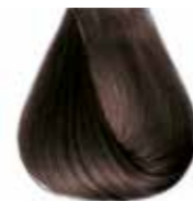
5/07 castano chiaro tabacco Light brown tobacco - Castaño claro tabaco Châtain clair tabac - Hellbraun Tabak Castanho claro tabaco Каштановый светлый табачный ΚΑΣΤΑΝΟ ΑΝΟΙΧΤΟ ΦΥΣΙΚΟ ΤΑΜΠΑΚΟ - كستاني فاتح بني مائل للصفرة