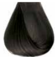
5/01 castano chiaro cenere Ash light brown - Castaño claro ceniza Châtain clair cendre - Hellbraun Kalt Castanho claro cinza Каштановый светло-пепельный ΚΑΣΤΑΝΟ ΑΝΟΙΧΤΟ ΕΝΤΟΝΟ ΣΑΝΤΡΕ - كستاني فاتح رمادي