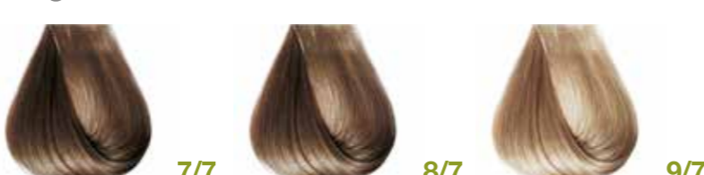
biondo beige Beige blond - Rubio beige - Blond beige Mittelblond Beige - Louro bege - Блондин Бежевый ΞΑΝΘΟ ΜΠΕΖ • ألوان البيج biondo chiaro beige Beige light blond - Rubio claro beige Blond très clair beige - Hellblond Beige - Louro claro bege Блондин светло-бежевый - ΞΑΝΘΟ ΑΝΟΙΧΤΟ ΜΠΕΖ كشكشى فاتح biondo chiarissimo beige Beige very light blond - Rubio clarissimo beige Blond très clair beige - Hell Hellblond Beige Louro clarissimo bege Блондин очень светлый бежевый ΞΑΝΘΟ ΠΟΛΥ ΑΝΟΙΧΤΟ ΜΠΕΖ • ألوان البيج فاتح