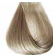
9/1 biondo chiarissimo cenere Ash very light blond - Rubio clarísimo ceniza Blond très clair cendre - Hell Hell Ashblond Louro clarissimo cinza Блондин очень светлый пепельный ΣΑΒΒΟ ΠΟΛΥ ΑΝΟΙΧΤΟ ΣΑΝΤΡΕ - انظر فاتح جدا رمادي