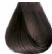
5/1 castano chiaro cenere Ash light brown - Castaño claro ceniza Châtain clair cendre - Hellaschbraun Castanho claro cinza Каштановый светло-пепельный ΚΑΣΤΑΝΟ ΑΝΟΙΧΤΟ ΣΑΝΤΡΕ - كستاني فاتح رمادي