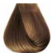
8/00 biondo chiaro intenso Intensive light blond - Rubio claro intensive Blond clair intensive - Hellblond Intensiv Louro clarissimo intensivo Блондин светлый интенсивный - ΣΑΒΒΟ ΑΝΟΙΧΤΟ ΕΝΤΟΝΟ ΣΑΒΒΟ - انظر فاتح كثيف