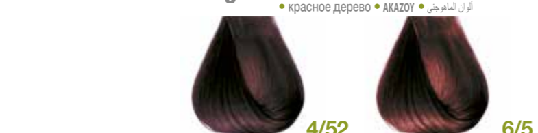
mogano violetto Violet mahogany - Caoba morado Acajou violet - Mittelbraun Mahagoni Violet Castanho claro lilás Каштановый фиолетовый ΚΑΣΤΑΝΟ ΑΚΑΖΟΥ ΒΙΟΛΕ • ألوان البندقى فاتح biondo scuro mogano Mahogany dark blond - Rubio oscuro caoba Blond foncé acajou - Dunkelblond Mahagoni Violet Louro escuro acaju Блондин темный красного дерева ΞΑΝΘΟ ΣΚΟΥΡΟ ΑΚΑΖΟΥ • ألوان البندقى فاتح