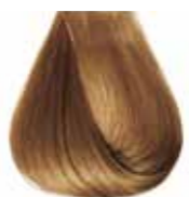
8/0 biondo chiaro Light blond - Rubio claro - Blond clair - Hellblond Louro claro - Блондин светлый - ΣΑΒΒΟ ΑΝΟΙΧΤΟ ΣΑΒΒΟ - انظر فاتح