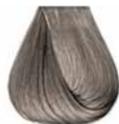
8/11 biondo chiaro cenere intenso Intensive ash light blond - Rubio claro ceniza intenso Blond clair cendre intense - Intensiv asch hellblond Louro claro cinza intenso - Блондин светлый интенсивный пепельный ΣΑΒΒΟ ΑΝΟΙΧΤΟ ΣΑΝΤΡΕ ΕΝΤΟΝΟ - انظر فاتح رمادي لكثيف