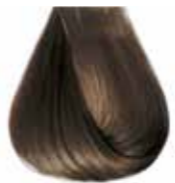
7/01 biondo naturale cenere Ash natural blond - Rubio natural ceniza Blond naturel cendre - Hellblond Kalt Louro natural cinza Блондин натуральный пепельный ΣΑΒΒΟ ΕΝΤΟΝΟ ΣΑΝΤΡΕ - انظر خيمر رمادي