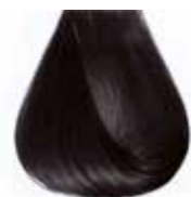
1/0 nero Black - Negro - Noir - Schwarz - Preto - Черный МАΥΡΟ - أسود