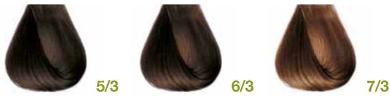
castano chiaro dorato Golden light brown - Castaño claro dorado Châtain clair doré - Hellbraun Gold Castanho claro dourado Каштановый светло-золотистый ΚΑΣΤΑΝΟ ΑΝΟΙΧΤΟ ΝΤΟΡΕ • ألوان الذهبي فاتح biondo scuro dorato Golden dark blond - Rubio oscuro dorado Blond foncé doré - Dunkelblond Gold Louro escuro dourado - Блондин темно-золотистый ΞΑΝΘΟ ΣΚΟΥΡΟ ΝΤΟΡΕ • ألوان الذهبي فاتح biondo dorato Golden blond - Rubio dorado - Blond doré Mittelblond Gold - Louro medio dourado Блондин золотистый - ΞΑΝΘΟ ΝΤΟΡΕ • ألوان الذهبي فاتح