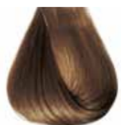
7/0 biondo naturale Natural blond - Rubio natural - Blond naturel Mittelblond - Louro natural - Блондин натуральный ΣΑΒΒΟ - انظر خيمر