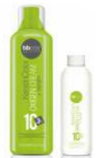
ОКИСЛИТЕЛЬ «KERATIN COLOR» 3%, 6%, 9%, 12% Арт. КОХ - 1000 мл Арт. КОХР - 150 мл