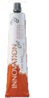
СТОЙКАЯ КРЕМ-КРАСКА ДЛЯ ВОЛОС «INNOVATION EVO» 100 мл