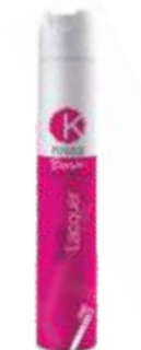
ЛАК ДЛЯ ВОЛОС СИЛЬНОЙ ФИКСАЦИИ Арт. BLSQ - 500 мл