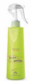
ШЕЛКОВАЯ ВОДА ДЛЯ ПОДГОТОВКИ К СТРИЖКЕ Арт. KSW - 300 мл