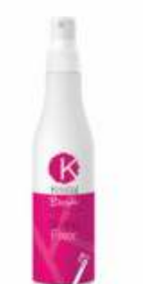
СПРЕЙ ДЛЯ ВОЛОС ЛЕГКОЙ ФИКСАЦИИ БЕЗ ГАЗА Арт. BSFX - 250 мл