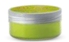
ГЕЛЬ ДЛЯ СТИЛИЗАЦИИ ВОЛОС Арт. KGJ - 100 мл