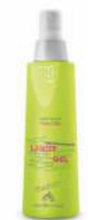
ЖИДКИЙ ГЕЛЬ ДЛЯ ВОЛОС Арт. KGL - 300 мл