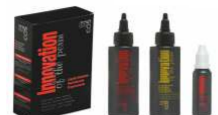
НАБОР СРЕДСТВ «БИО-ЗАВИВКА» Арт. IP - 100 мл + 80 мл + 20 мл