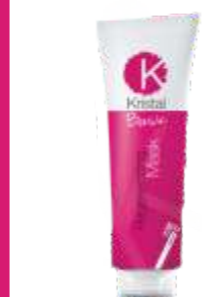
ВОССТАНАВЛИВАЮЩАЯ МАСКА ДЛЯ ВОЛОС Арт. BRM1-1500 мл Арт. BRM - 400 мл