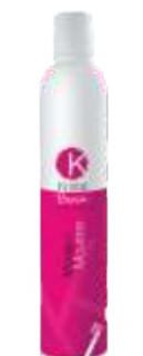
МУСС ДЛЯ ВОЛОС СИЛЬНОЙ ФИКСАЦИИ Арт. BSMO - 500 мл