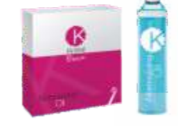
НОРМАЛИЗУЮЩЕЕ МАСЛО ДЛЯ ВОЛОС Арт. BNO - 12 ампул по 10 мл