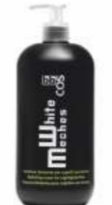
КОНДИЦИОНЕР-МАСКА ДЛЯ ОСЛАБЛЕННЫХ ВОЛОС Арт. WMM-1000 мл