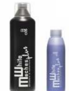
ОКИСЛИТЕЛЬ ДЛЯ ОСВЕТЛЕНИЯ ВОЛОС Арт. AWM - 1000 мл Арт. AWMP - 150 мл