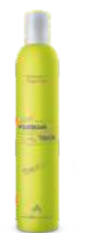
ПИТАТЕЛЬНЫЙ ШАМПУНЬ ДЛЯ ВОЛОС Арт. ESN1-1000 мл Арт. ESN - 300 мл