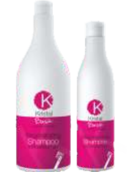
ШАМПУНЬ ВОССТАНАВЛИВАЮЩИЙ Арт. BRS - 500 мл Арт. BRS5-5 л Арт. BRS1 - 1500 мл Арт. BRS10-10 л