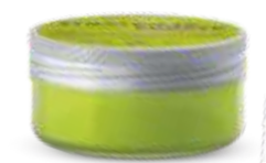
МОДЕЛИРУЮЩАЯ ПАСТА ДЛЯ ВОЛОС Арт. KWAX - 100 мл