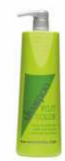
КЕРАТИНОВЫЙ ШАМПУНЬ после окрашивания Арт. КЕС - 1000 мл Арт. КЕС3 - 300 мл