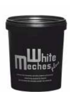
ОСВЕТЛЯЮЩАЯ ПУДРА Арт. WMP - 500 гр Арт. WMPB - 20 гр