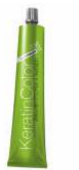
СТОЙКАЯ КРЕМ-КРАСКА «KERATIN COLOR» 100 мл