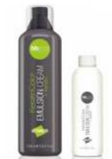
КРЕМ-ЭМУЛЬСИЯ «KERATIN COLOR» 1,5% Арт. ЕСК - 1000 мл Арт. ЕСКР - 150 мл