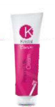
КРЕМ-КОНДИЦИОНЕР ДЛЯ ВОЛОС С МИНДАЛЬНЫМ МОЛОЧКОМ Арт. BAC1-1500 мл Арт. BAC - 400 мл