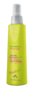
УВЛАЖНЯЮЩИЙ ШАМПУНЬ ДЛЯ ВОЛОС Арт. ESI1-1000 мл Арт. ESI - 300 мл