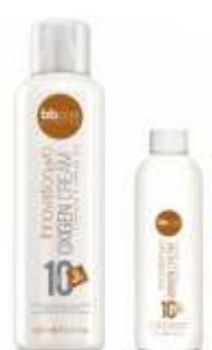
ОКИСЛИТЕЛЬ «INNOVATION EVO» 3%, 6%, 9%, 12% Арт. ОХЕ - 1000 мл Арт. ОХР - 150 мл