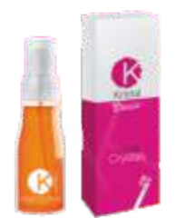
СРЕДСТВО КОСМЕТИЧЕСКОЕ «ЖИДКИЕ КРИСТАЛЛЫ» Арт. BLCR - 50 мл