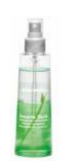
ДВУХФАЗНАЯ ЖИДКОСТЬ ДЛЯ ВОЛОС «KERATIN» Арт. КФВ - 150 мл