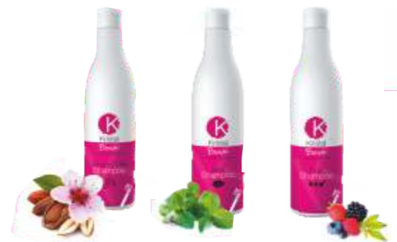
ШАМПУНЬ ДЛЯ ВОЛОС - С МИНДАЛЬНЫМ МОЛОЧКОМ - С ПЕРЕЧНОЙ МЯТОЙ - ФРУКТОВЫЙ 500 мл, 1500 мл, 5 л, 10 л