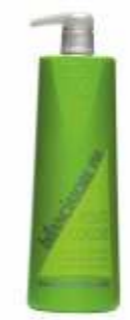
КЕРАТИНОВЫЙ КРЕМ-БАЛАНС pH Арт. КЕВ - 1000 мл Арт. КЕВ3 - 300 мл