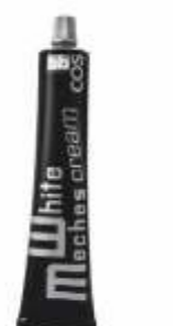
КРЕМ ДЛЯ ОБЕСЦВЕЧИВАНИЯ ВОЛОС Арт. WMC - 120 мл