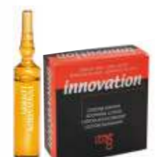
СМЯГЧАЮЩИЙ ЛОСЬОН Арт. ILL 12 ампул по 10 мл