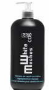
ШАМПУНЬ ДЛЯ ОБЕСЦВЕЧЕННЫХ ВОЛОС Арт. WMS-1000 мл