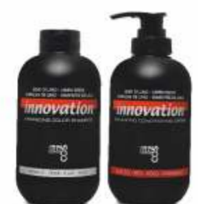
ШАМПУНЬ И МАСКА «ОБНОВЛЕНИЕ ЦВЕТА» (серебристый, блонд, каштановый, красный) 250 мл