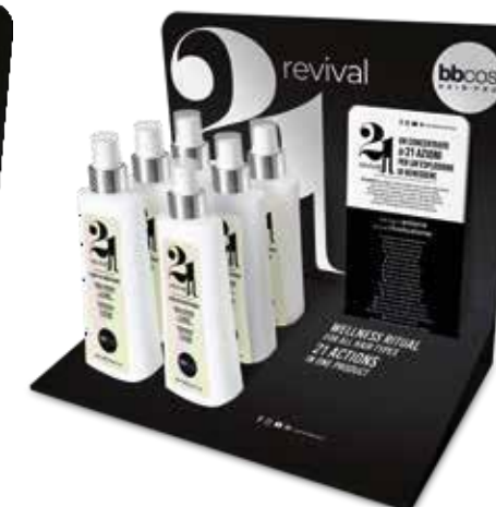
витрина-дисплей 21 в 1 250 мл