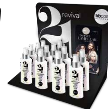
витрина-дисплей 21 в 1 100 мл