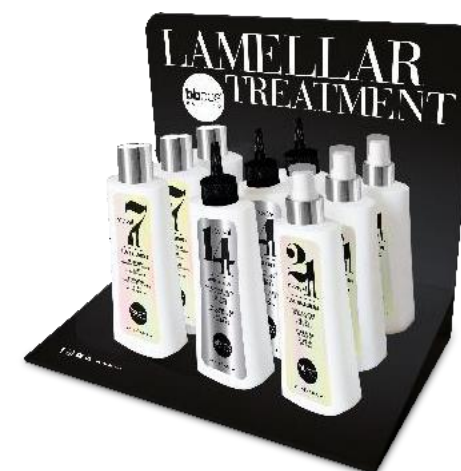
витрина-дисплей с ламеллярным уходом